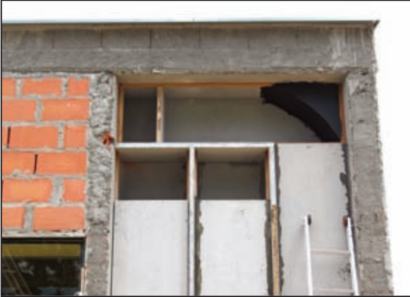
Seqüência tubos III: Visão externa dos tubos, dois prontos e terceiro sendo sintonizado

medida que conversávamos foram se estabelecendo pontos em comum entre sua forma de avaliar sistemas de reprodução eletrônica e minha forma de avaliar espaços acústicos.