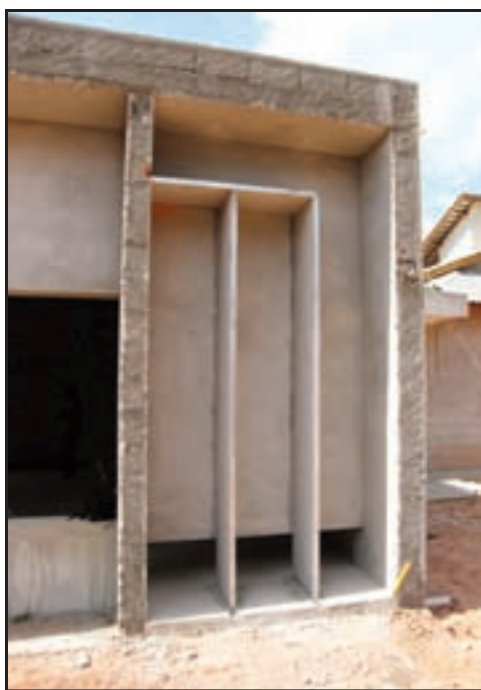
Aberturas na alvenaria da parede frontal para tubos sintonizados

Outro cuidado extremo ocorreu na parte elétrica com a escolha dos cabos. Do poste de entrada de luz até a sala, o cabo utilizado (quase 50 metros) foi o Power Clean da Logical Cables . Da chave seccionadora até as tomadas dedicadas, o cabo utilizado foi o Furutech FP 3 TS 20 . Do projeto original ainda falta produzir três difusores do teto (os que ficam em cima do ouvinte) e cobrir as estantes com o mesmo tecido das paredes.