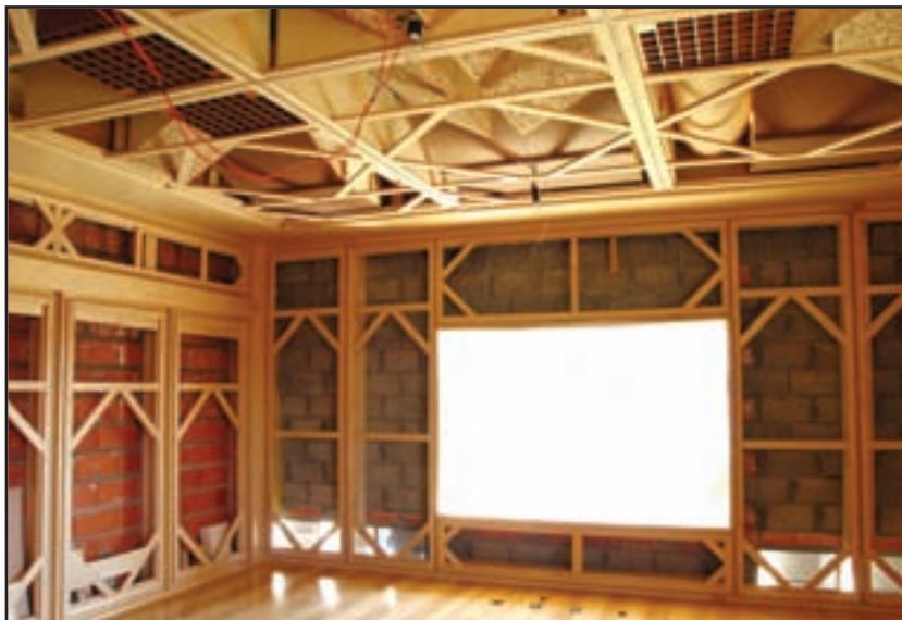
Detalhe da estrutura: Riqueza de relevo da estrutura com painéis de tecido

freqüências como candidatas. As freqüências definitivas seriam determinadas após testes e experimentações utilizando o sistema. A partir de então, absorvedores sintonizados em freqüências médio graves poderiam ser acrescentados nas paredes laterais conforme necessário para fazer um ajuste mais fino.